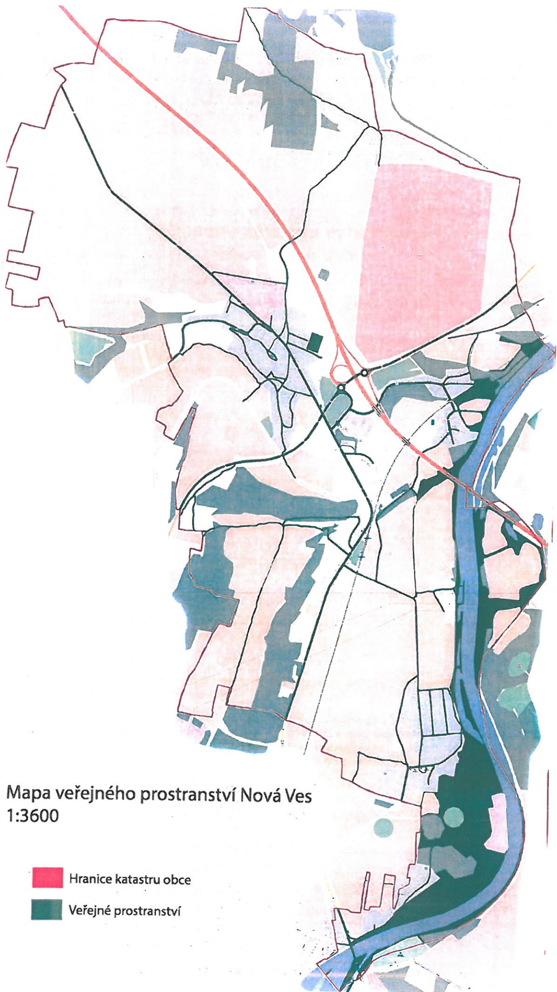
Mapa veřejného prostranství Nová Ves 1:3600