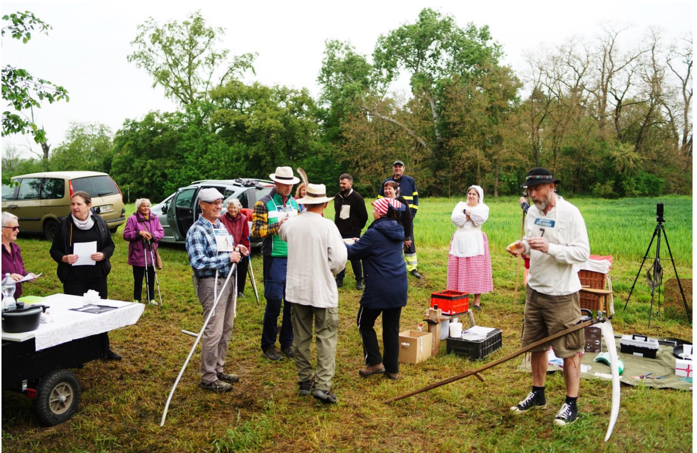
Novoveský sekáč / středa 8. května 2024

Miřejovice · Nová Ves · Nové Ouholice · Staré Ouholice · Vepřek