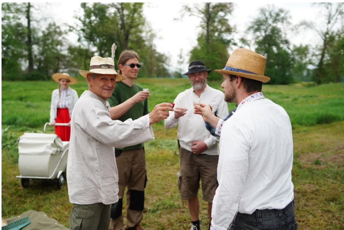
Momentka z Novoveského sekáče