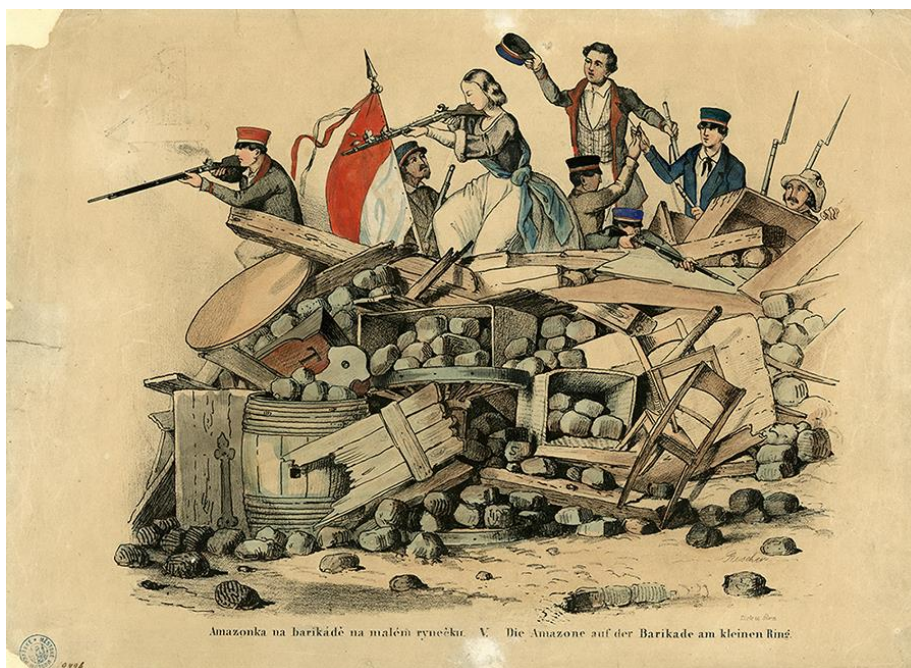
Studenti a bojující "Amazonka" na pražské barikádě 1848, Bedřich Anděl podle Fr. Roschera, kolorovaná litografie.

Pak už to nebyla taková pravidelná selanka. Musel se hodně ohánět, aby za celý boží den obešel všechny své příznivce, oslovil známé i neznámé paní na městském rynku, postál hodinku u radničních vrat, když se pánové rozcházeli po náročném celodenním jednání. Většinou z nich nevypadl jediný penízek, ale pro Tatka to byla součást jeho reklamní kampaně – musel být viděn těmi nejvyššími městskými úředníky, aby naň nebylo zapomenuto. Zapomnění, to bylo to, čeho se nejvíc obával. Aby nepřišel o svou denní dávku almužen, aby na něj zbylo k stáru místo v místním špitále a – třikrát se Tatak rozhlédl kolem, zda ho nikdo při jeho ranním vnitřním monologu neslyší – hlavně střídal penízky na hrobku na městském hřbitově. Místo měl už dávno vyhlídnuté a s panem děkanem domluvené. Každoročně přispíval na záduší pro děkanský kostel, tajně ovšem. Aby to jeho městští dobrodinci neviděli. Panu děkanovi byl každý penízek dobrý, nebádal nad tím, kde žebrák k penězům značné hodnoty přišel. Jen mu nikdy žádné almužny nepodal.