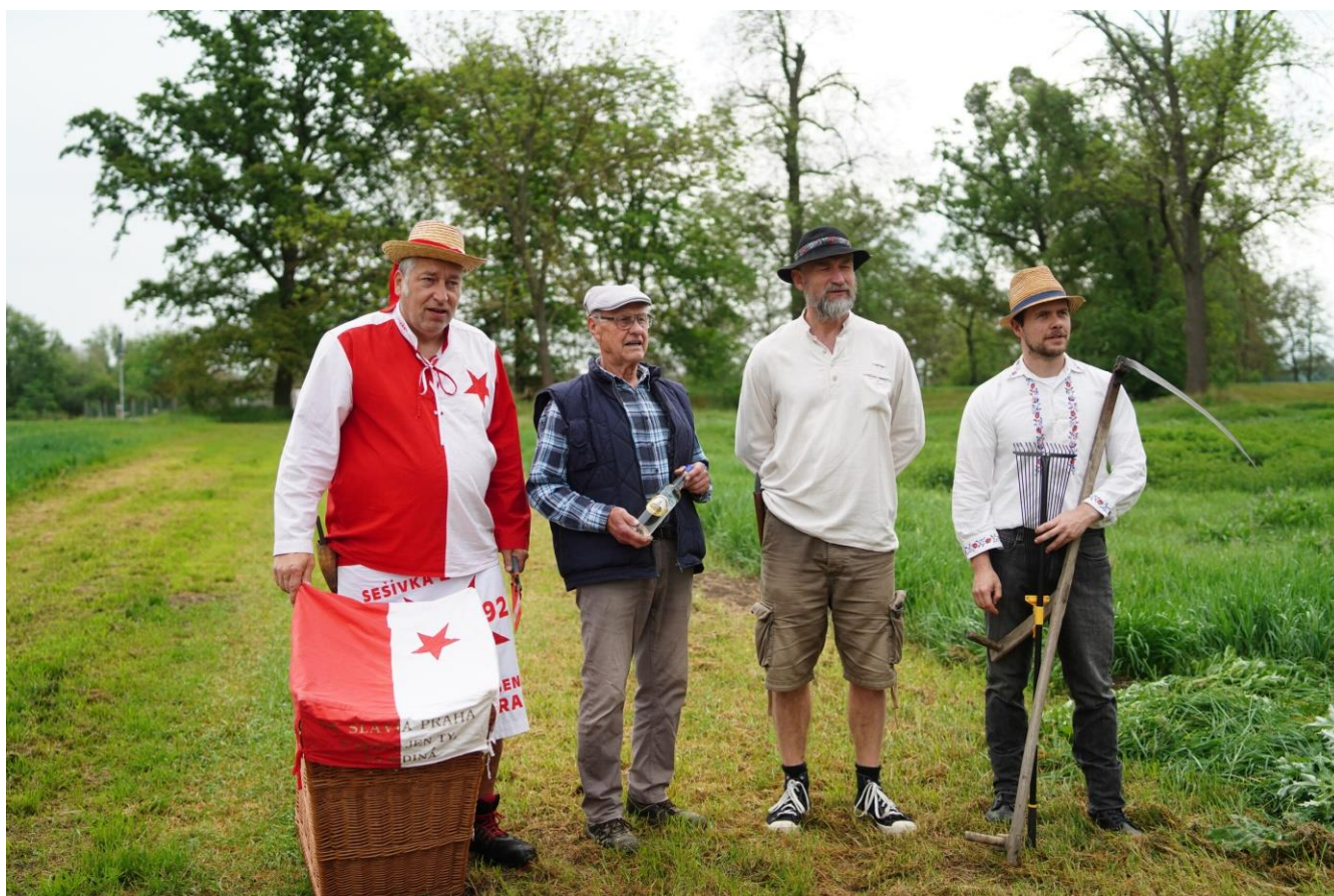
vítězové mužské kategorie