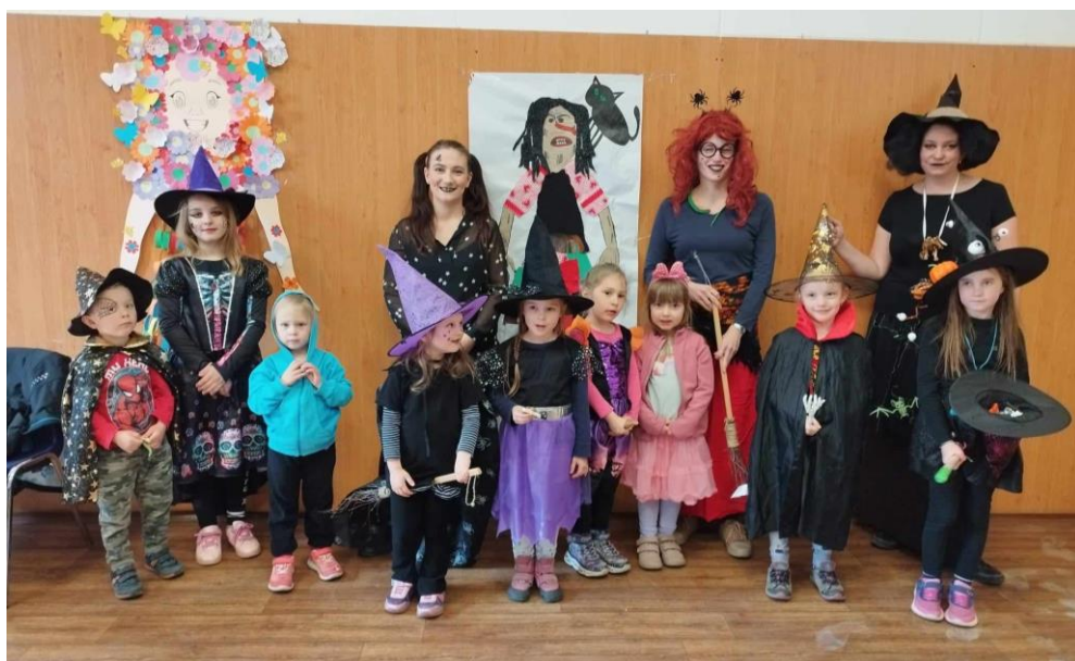
Čarodějnická „sebranka“ z klubíku Lvíček