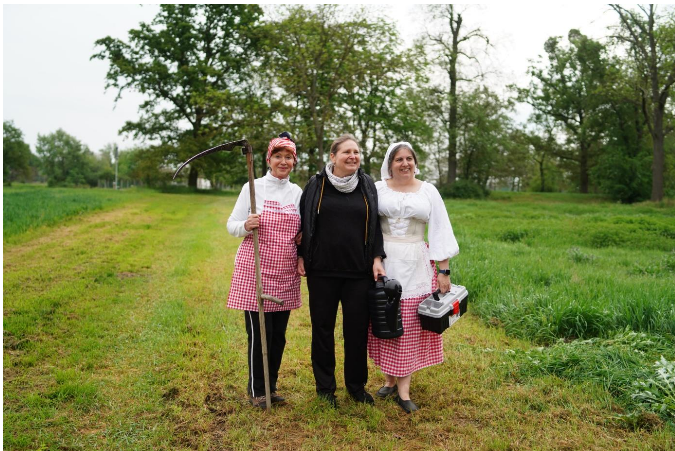
vítězky ženské kategorie