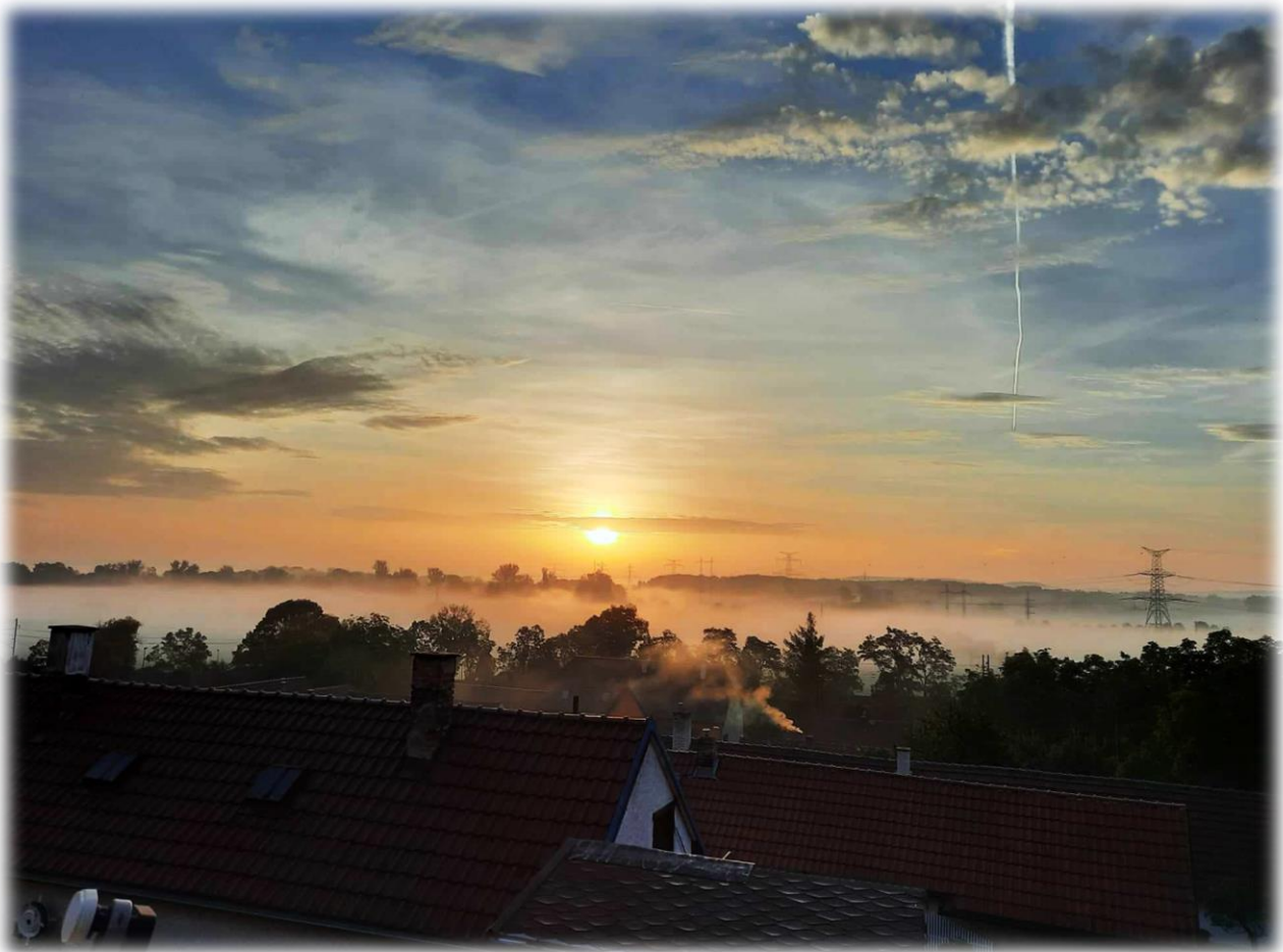
Podzimní svítání v Nových Ouholicích