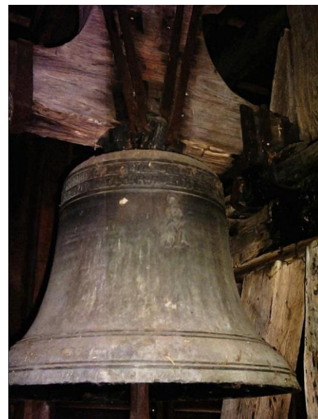
Foto zvonu Jan Křtitel z června 2007

Po prohlídce zvonů v červnu roku 2007 jsem na svém webu o Vepřku zveřejnila fotografie našich dvou zvonů a k nim tento zápis: „Pamětní kniha obce Vepřku 1919–1939 mluví o zvonu Marie jako o zvonu, který má okolo koruny gotickou minuskulí 3 cm vysoko latinský nápis, jinak bez ozdoby. Jenže zvon Marie, který je na první pohled větší než Malý zvon, ozdobu má – je na něm znatelná postava. A je tam vidět postava mužská (má vousy), takže se nutně nabízí pochybnosti. Že by v dávné minulosti došlo k záměně zvonu Marie za zvon Jan Křtitel? Kronika zmiňuje v jeho případě na plášti reliéf sv. Petra , což odpovídá tomu, co vidím.“