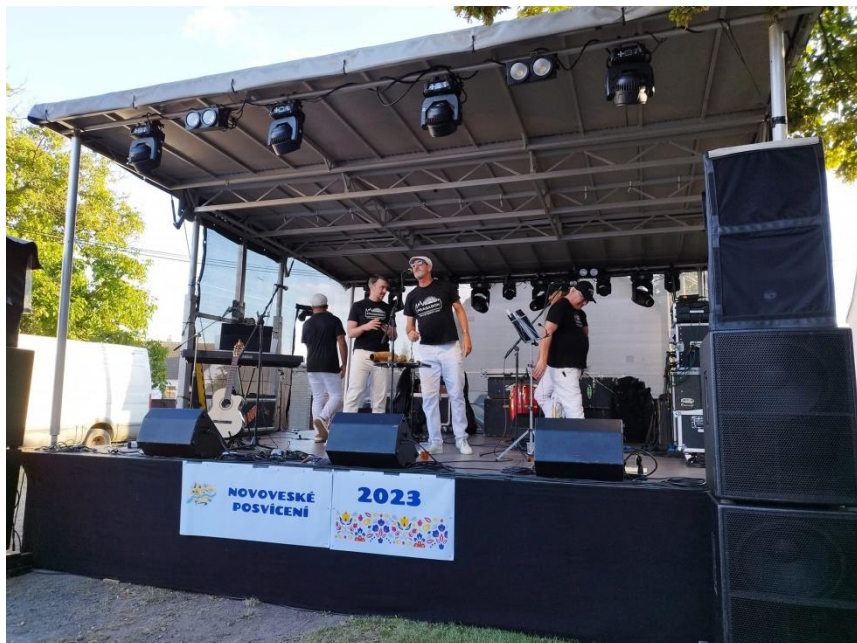
Skupině PRAGASÓN se podařilo rozvlítnit mnohé z přítomných „Doufáme, že příští rok přijede Pragasón zase.“ M.