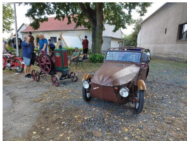
„Zas to skvěle vyšlo!“ L. „Vikingové byli ÚPLNĚ SUPER!“ V.