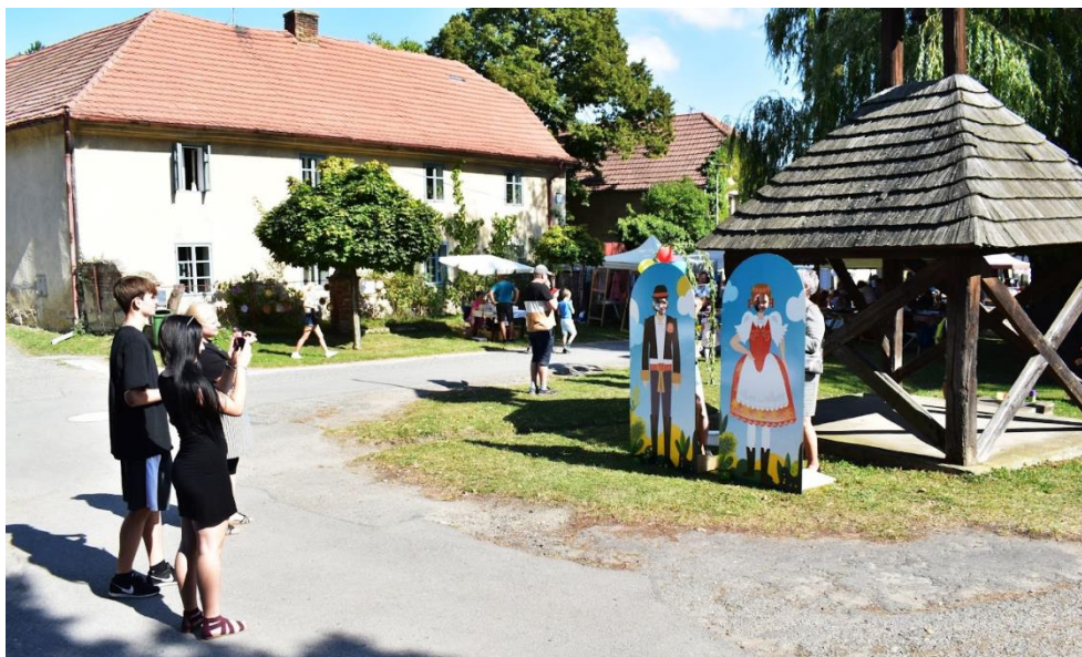
Momentka z Novoveského posvícení