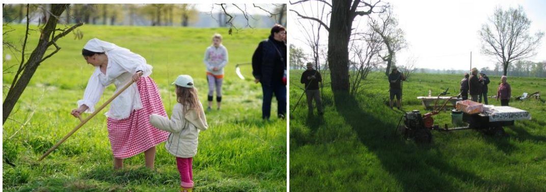
bez komentáře / zázemí s občerstvením