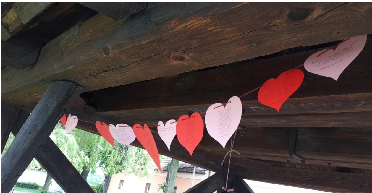
Poezie ve zvonici na návsi – zastavte se cestou... (Autor: J. Jordáková)