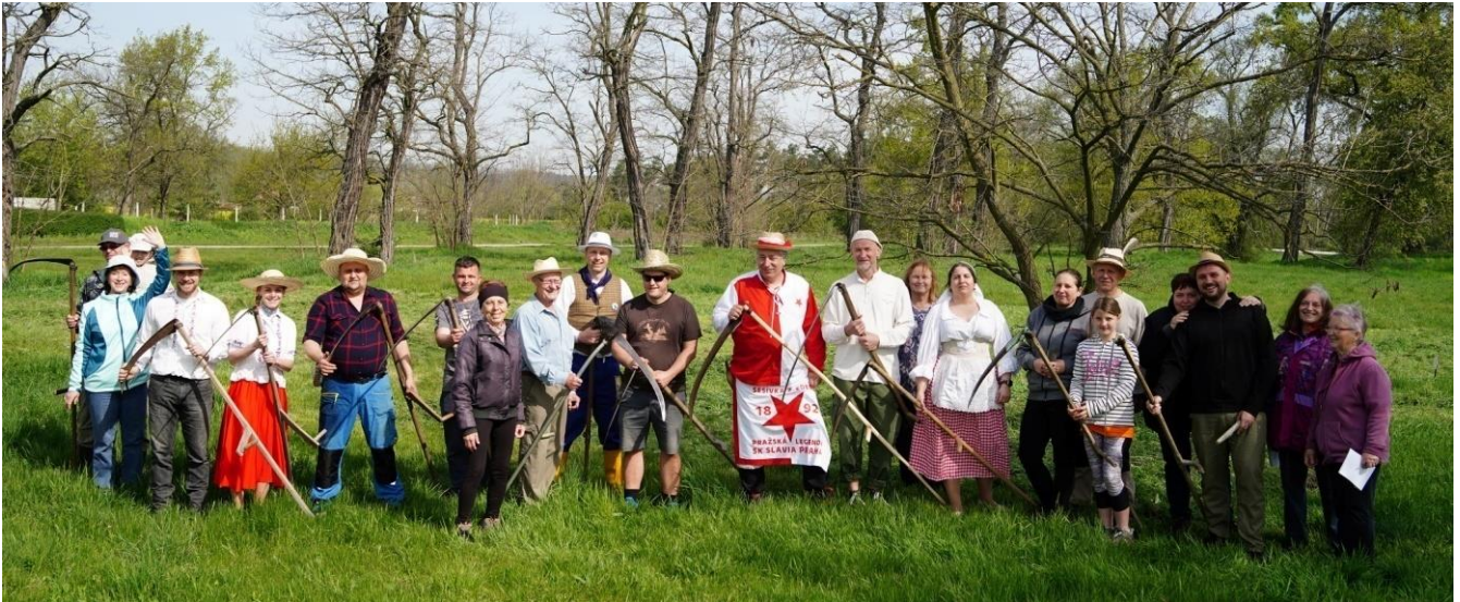
aktivní účastníci klání