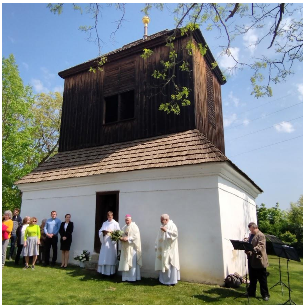
Požehnání zvonů / Vepřek / sobota 20. května 2023