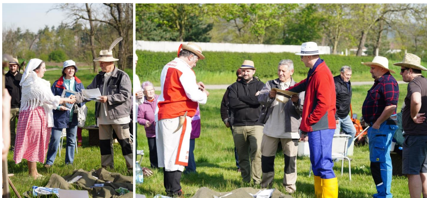
Předání diplomů vítězům minulých let / losování

Všem ostatním za účast a dobrou pohodu ať již jako soutěžící nebo přihlížející.