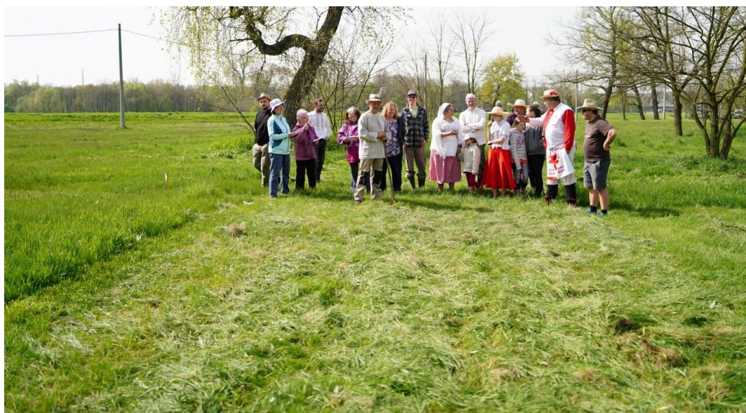
společné hodnocení kvality sečení