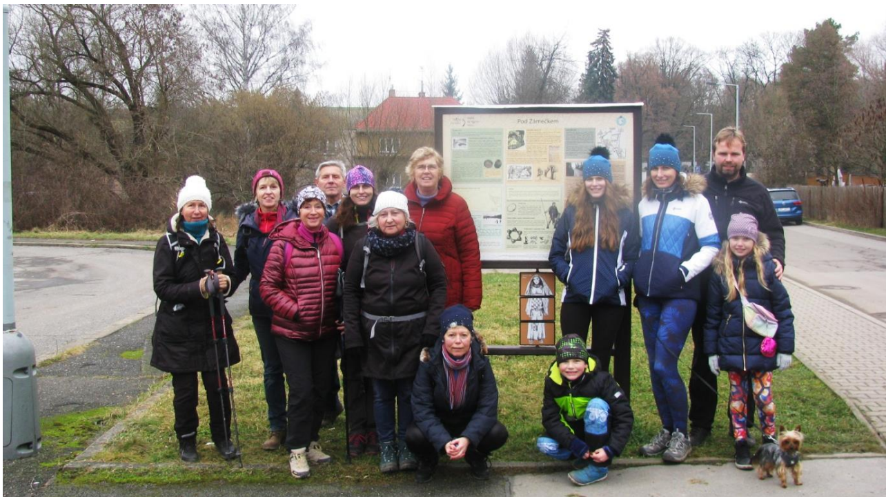
8. ledna - Pěkný pohodový výlet Kudykamu za slušného počasí, při kterém jsme prošli Drahanské, Čimické a Bohnické údolí a na závěr navštívili rybárnu v Dolních Chabrech.