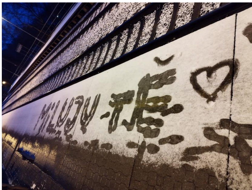
Zachyceno v Nových Ouholicích 18. ledna 2023