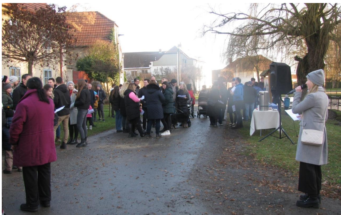
Tradiční pohodové štedrodenní setkání u novoveské zvoničky proběhlo za zpěvu koled a občerstvení

Přirozeným pokračováním pak byla cesta na Vepřek pro Betlémské světlo. Po roce jsme si opět mohli prohlédnout betlém z 18. století a pozdravit se sousedy a známými, kterých i letos přišlo požehnaně.