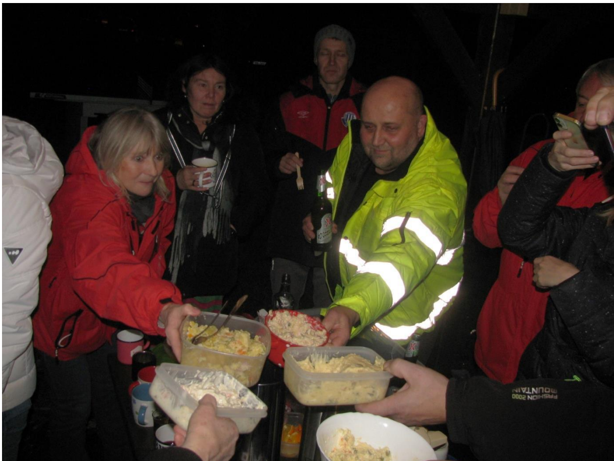
V Měřejovicích se v předvečer štědrého dne soutěžilo o nejlepší bramborový salát – na vítězi nebyla shoda - všichni měli ten nejlepší.