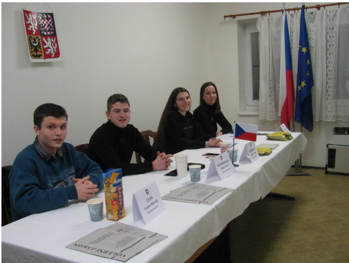
„Volby s úsměvem“ – Nové Ouholice

Připravila Bohdana Tobiášková, informační výbor ( www.volby.cz )