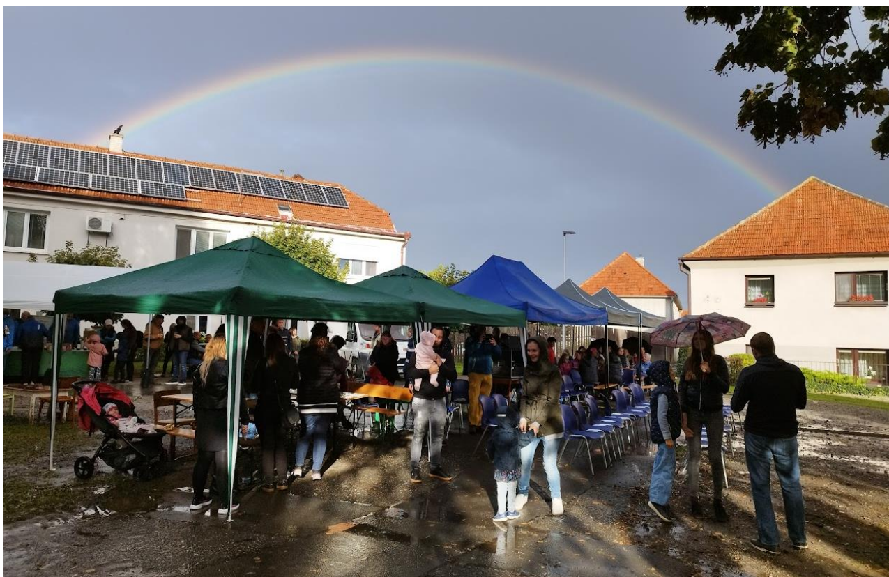
Posvícení – po přeháňce se objevila nad návsí duha