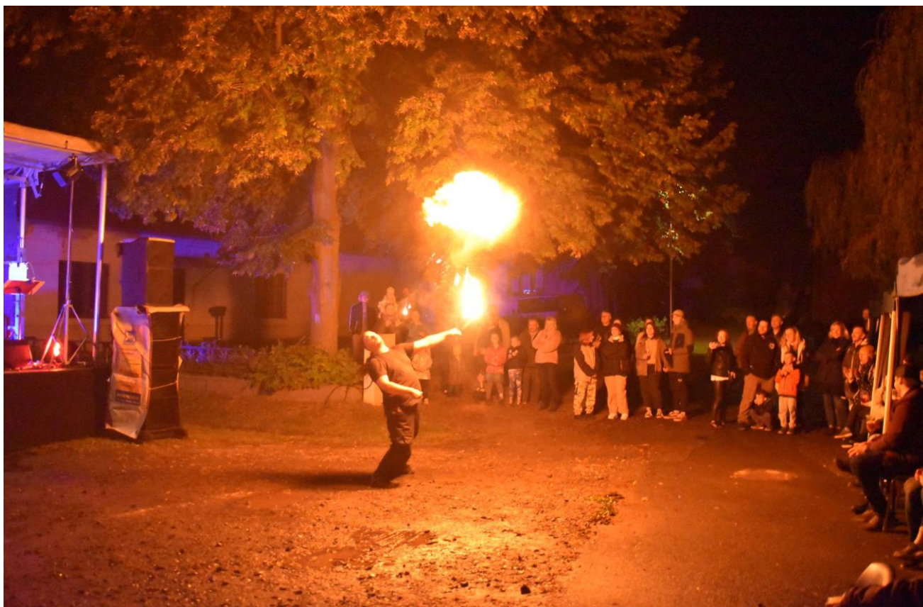
Novoveské posvícení – ohňová show Adversarios / 17. září 2022