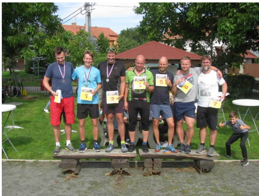
7 statečných z dopoledního triatlonu

členům týmů. K výkonům určitě přispěly i příznivé povětrnostní podmínky a skutečnost, že letos v zámeckém parku nebylo takové množství výletníků jako obvykle. Aktivní účastníci klání – tj. závodníci přišli/přijeli převážně z okolí (Nelahozeves, Postřizín, Kralupy, Vepřek, Nové Ouholice, Dolany, Lešany, Miřejovice), jeden ambiciózní tým přijel opakovaně z Mělníka.