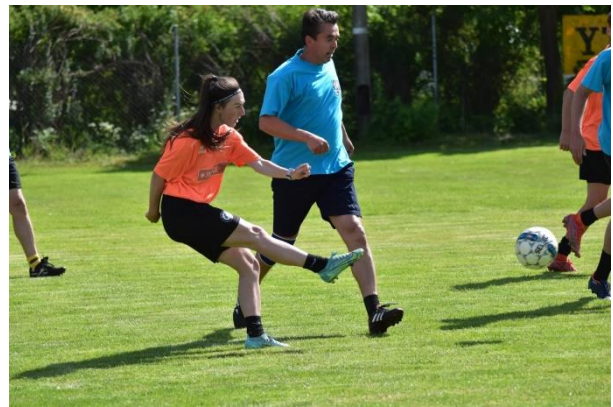
4 týmy se zúčastnily fotbalového turnaje (gratulace vítězné Nové Vsi).