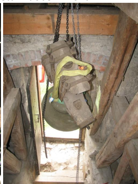
Hlavice zvonu/ Spouštění zvonu