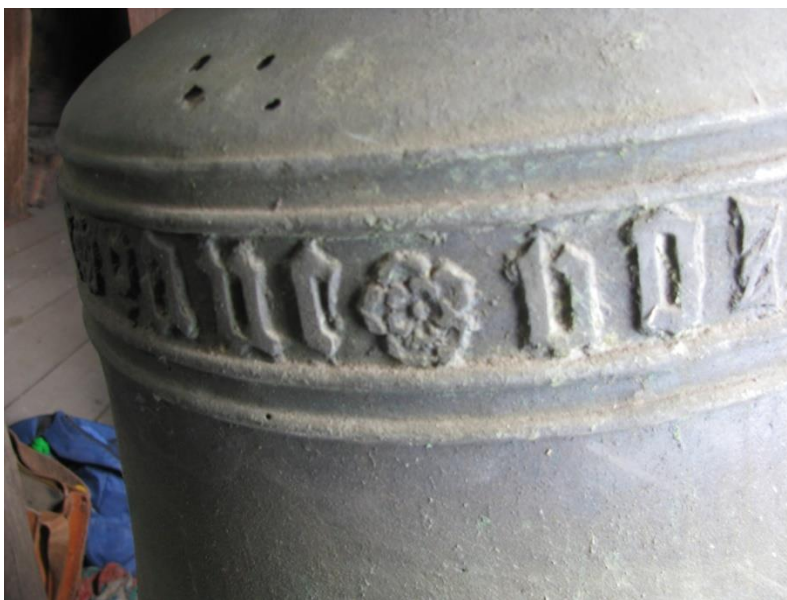
Ten, o kterém je řeč – mistr zvonařský / Detail zdobení zvonu