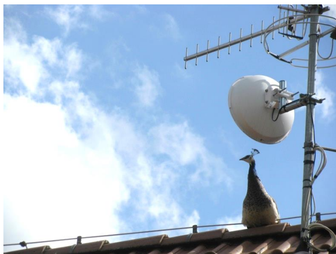
Autor: B. Vognič