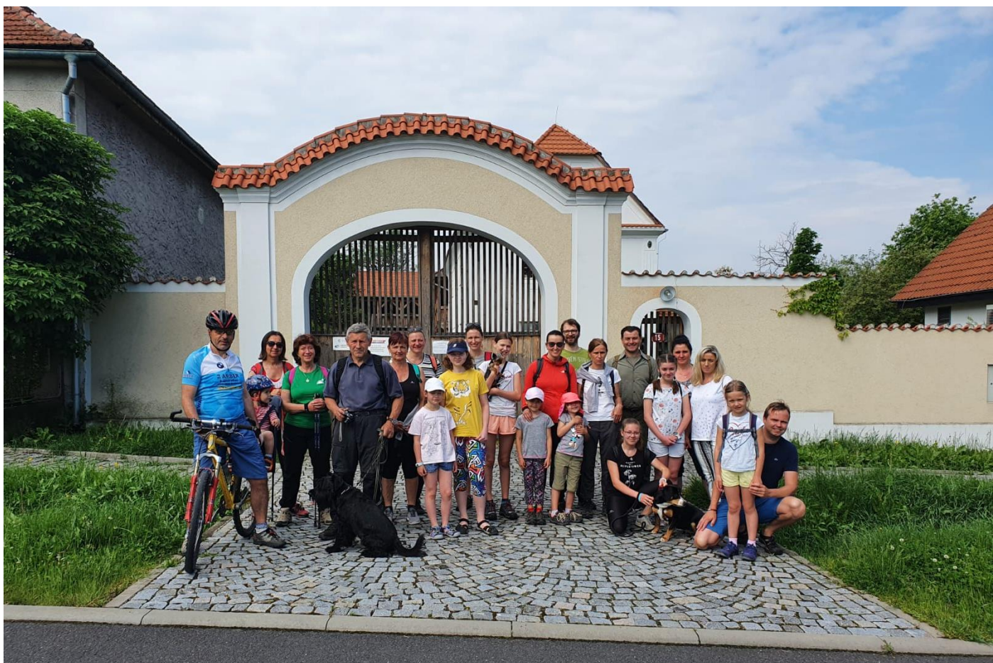
Turistický klub KUDYKAM /Ledčice / 6. června 2021