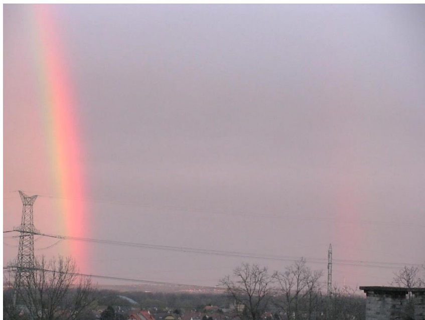
Dvojitá duha nad Starými Ouholicemi