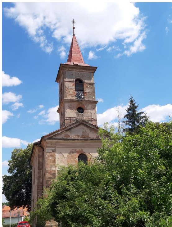
Kostel Stětí sv. Jana Křtitele v Pozdeni