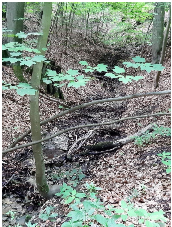
Pramen Bakovského potoka