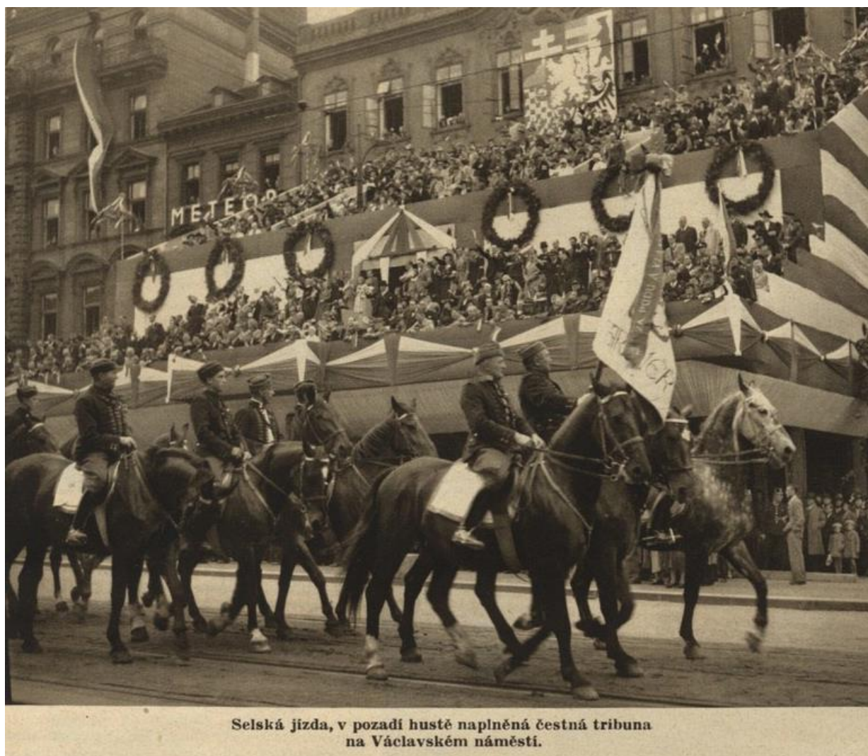
Selská jízda, v pozadí hustě naplněná čestná tribuna na Václavském náměstí.