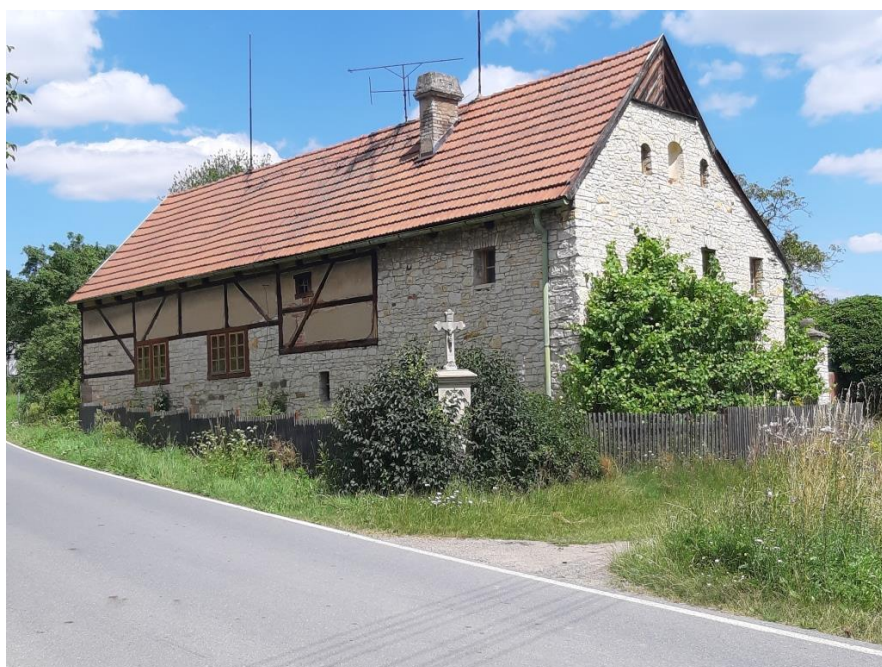
Historický dům č. p. 16 v Kalivodech