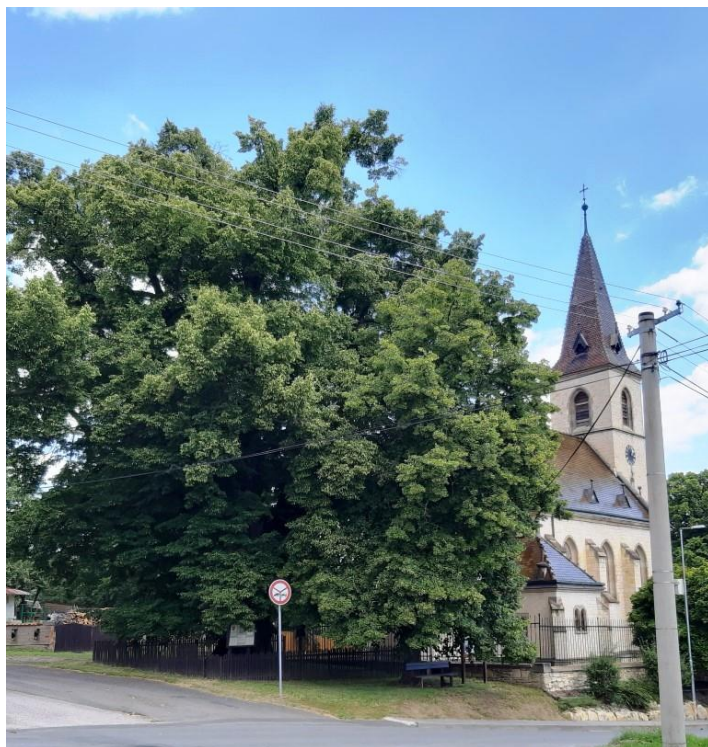
Kostel Sv. Markéty v Kroučové

přikrmovali, od této dávky byli osvobozeni pouze nájemci dvou domů, kteří se o chrty v těchto domech starali. Znak obsahuje i ratolesti chmele, které značí dlouholetou tradici jeho pěstování v této oblasti i fakt, že zde byl v roce 1891 založen První chmelařský spolek v Království českém. Hornické symboly v horní části znaku dokládají více než stoletou těžbu černého uhlí v obci i v okolí. V Kroučové mají krásný kostel svaté Markéty v těsném sousedství mohutné, letité lípy.