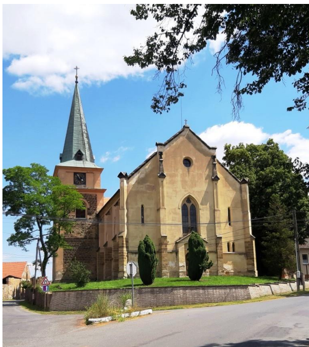
Kostel sv. Jakuba Většího v Srběči

Další obcí, kterou jsme navštívili, je Srběč s dominantou farního kostela svatého Jakuba Většího. Přestože Bakovský potok na své cestě na severovýchod nabírá jen nesměle na síle, zvládne napájet několik rybníků. S jistou nadsázkou by se dalo říct, že krajina v této oblasti připomíná jižní Čechy. Spálený a Dubový rybník, Babinec – to vše jsou krásná místa s minimem civilizace v bezprostředním okolí.