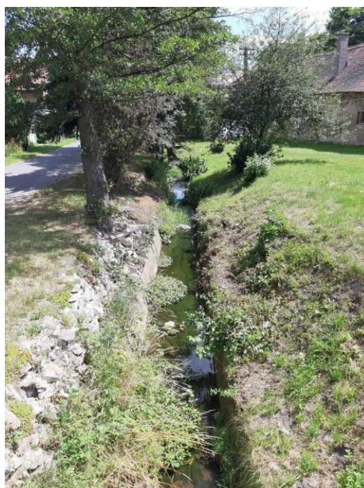
Bakovský potok v Srběči

Mezi obcemi Pozdeň a Plchov dává Bakovský potok svou energii největšímu ze zdejších rybníků. Plchovský rybník má rozlohu téměř 7 hektarů, jeho založení bylo dokončeno v roce 1980 a slouží jako závlahové zařízení. V obci Pozdeň stojí krásný kostel Stětí sv. Jana Křtitele, který byl vystavěn již v roce 1289. Kostel má vzhledem k věku velmi bohatou historii, v 19. století proběhla přestavba v barokním slohu a v této podobě vydržel až dodnes. Kostelní věž zdobí hodiny. Jednotlivé strany věže směřují k sousedním obcím – Lískému, Hřešicím,