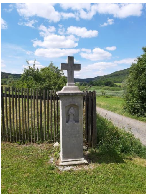
Žaludův kříž v Kalivodech

V blízkosti obce Kalivody se milovníkům přírody nabízí výlet po naučné stezce „Kalivodské bučiny“. Jedná se o jednu z nejzachovalejších přírodních lokalit Džbánska.