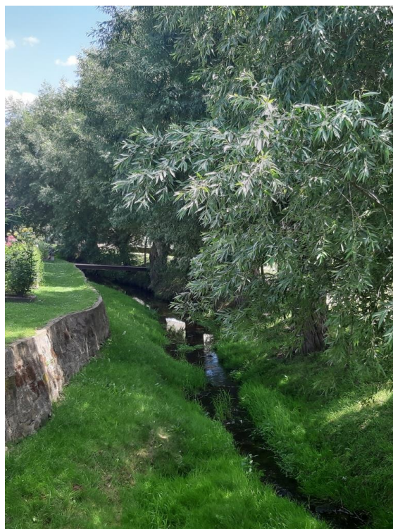
Bakovský potok v Plchově

Nyní máme za sebou zhruba jednu třetinu naší cesty. Další zajímavá místa, ke kterým nás dovedl Bakovský potok, Vám představíme v srpnovém čísle Novoveského zpravodaje.