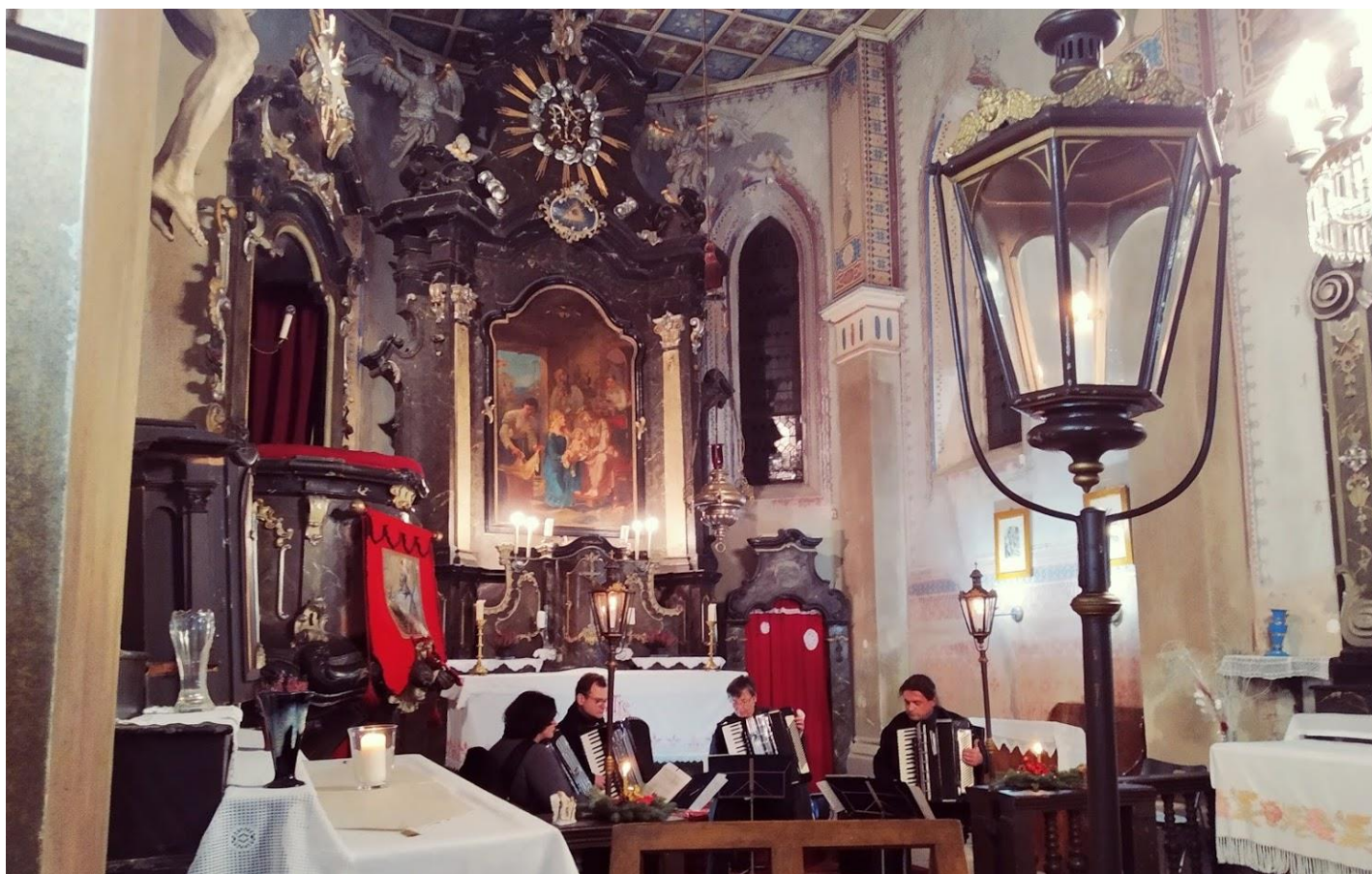
Adventní koncert / Pražské barokní harmoniky ve Vepřku

Miřejovice · Nová Ves · Nové Ouholice · Staré Ouholice · Vepřek