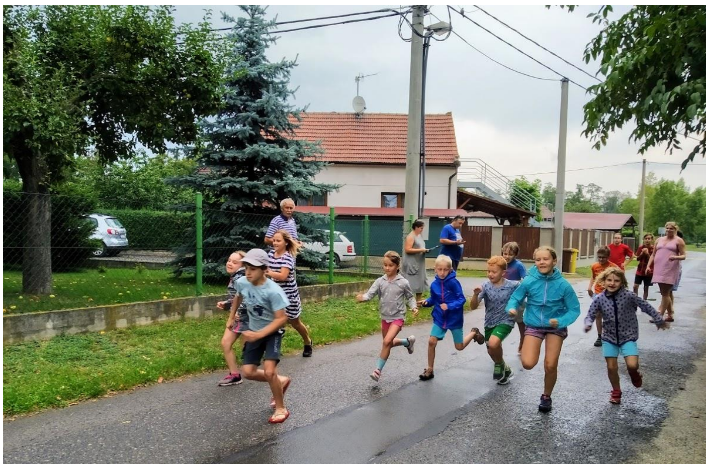
Novoveský úprk / 1. září 2019