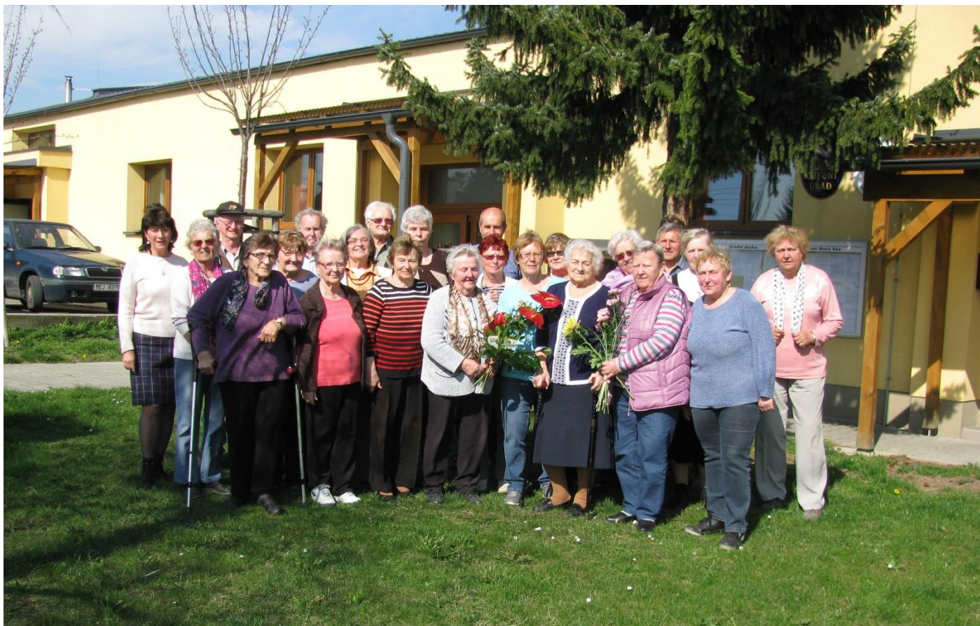
Spolek seniorů / setkání spolku 4. dubna 2019