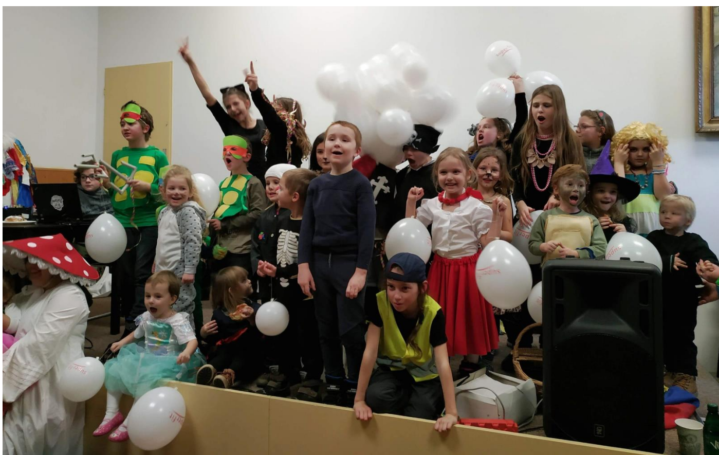
Zábava na sále