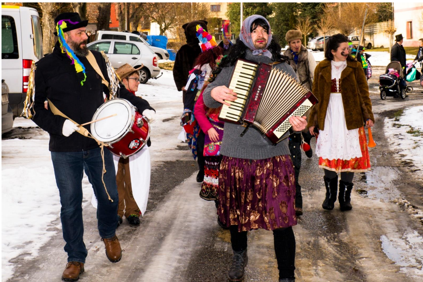
Průvodem kolem rybníčku