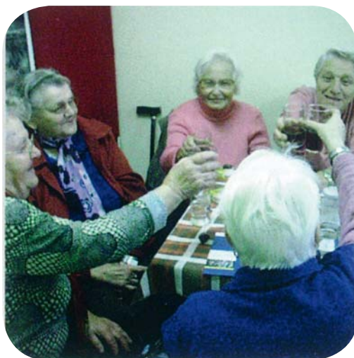
milé dříve narozené členky