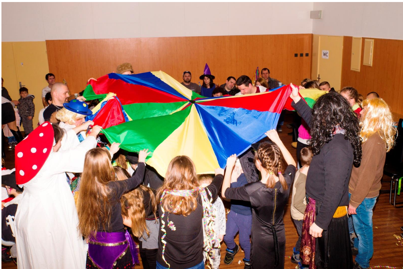
Diskotéka, soutěže, tombola ...