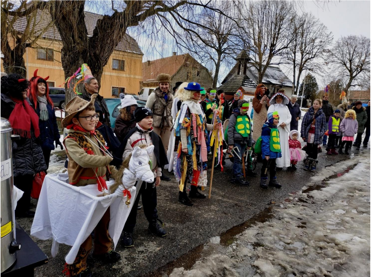
Čekání na medvěda

Sobota 9. února patřila v Nové Vsi Masopustu – bylo to barevné, veselé, hlučné a my doufáme, že jste se všichni dobře bavili!