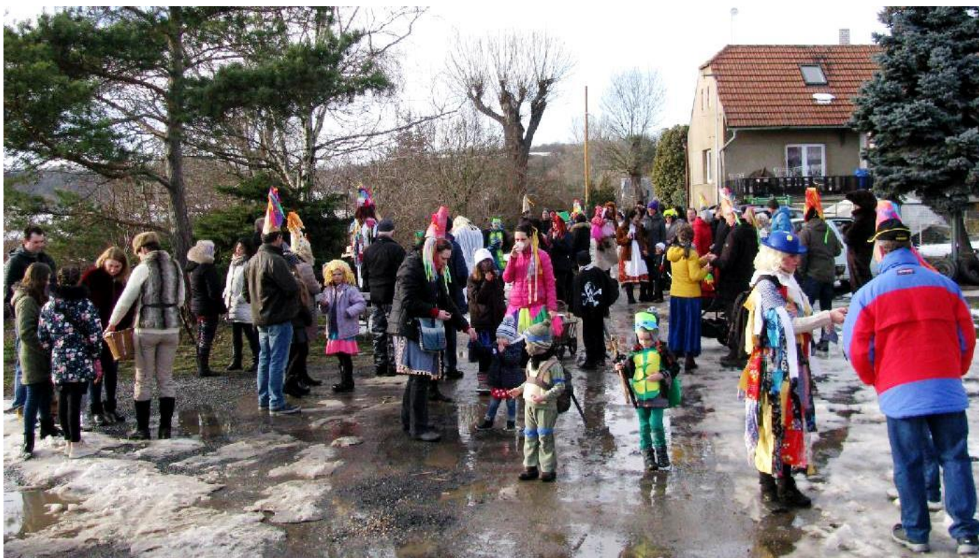
Vesnicí s muzikou a občerstvením – koblížky, uzeným a klobáskami, letos se nás sešlo požehnaně – děti, dospělí, v maskách i bez.