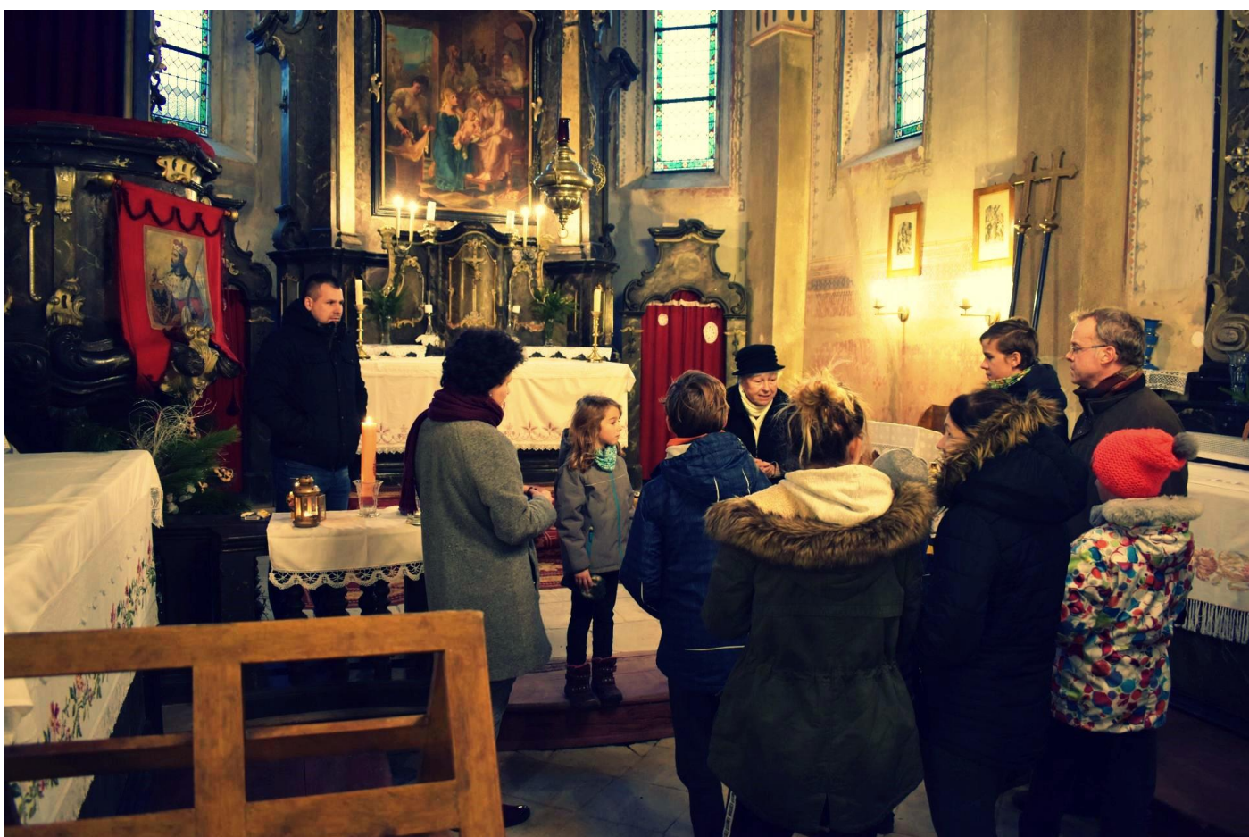
Kostel ve Vepřku / Rozdávání Betlémského světla / 24. 12. 2018