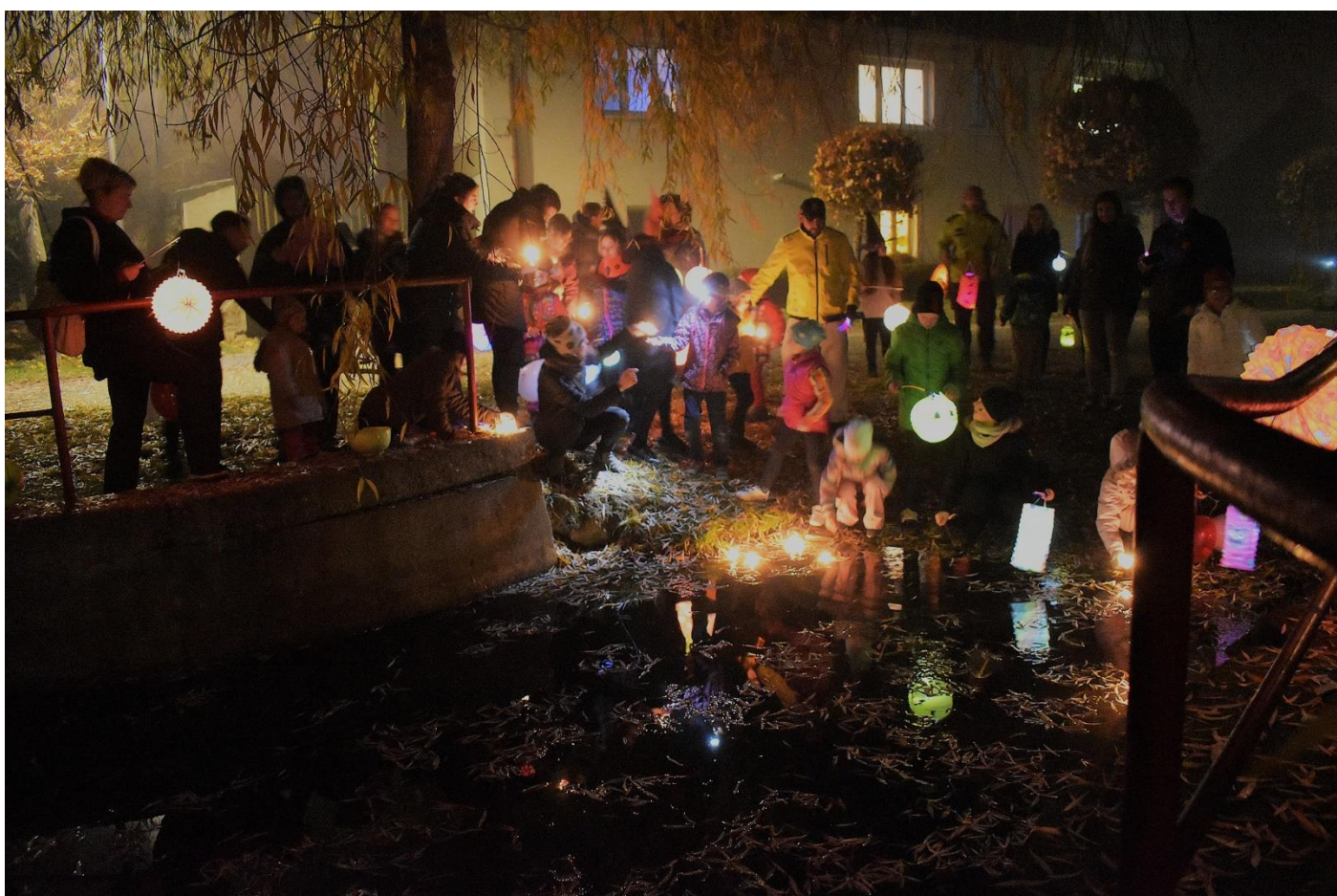
Lampionový průvod / návěs / 16. 11. 2018