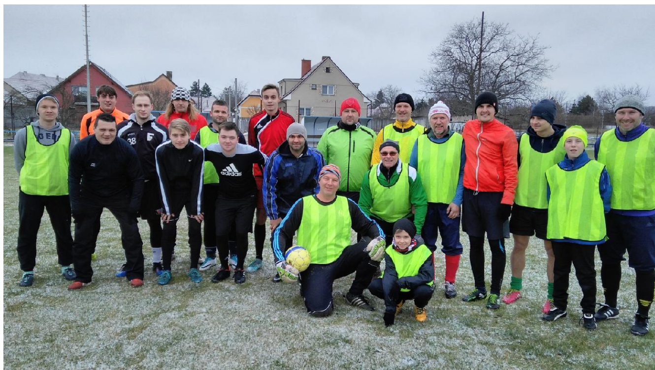
/Silvestrovský fotbálek – Starý vs. Mladý/

Do poslední ankety bylo zahrnuto celkem 422 hlasů a Nová Ves jich posbírala hned 350, Sokol tak byl ze všech klubů suverénně nejvyš.