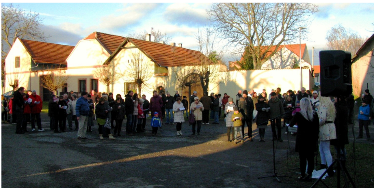
Štědrý den na návsi

Miřejovice · Nová Ves · Nové Ouholice · Staré Ouholice · Vepřek