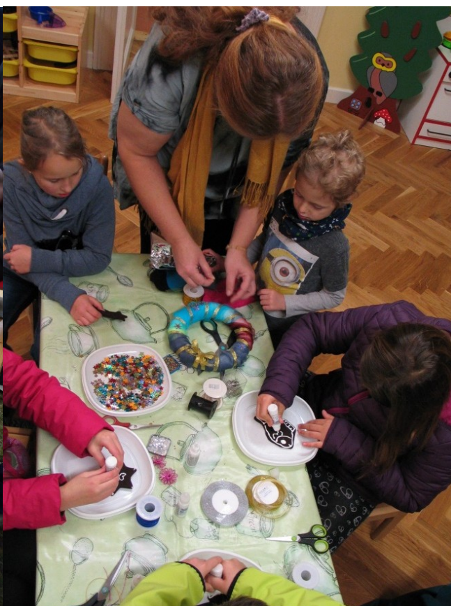
výroba vánočních dekorací