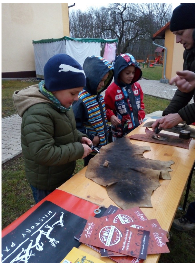
Rozdělávání ohně „postaru“