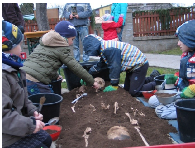
History park a mladí archeologové