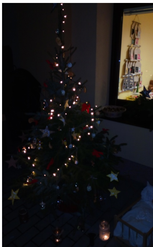
... a už nám svítí!