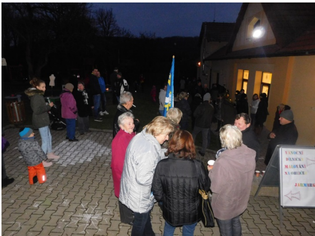
Už se lidé scházejí ...