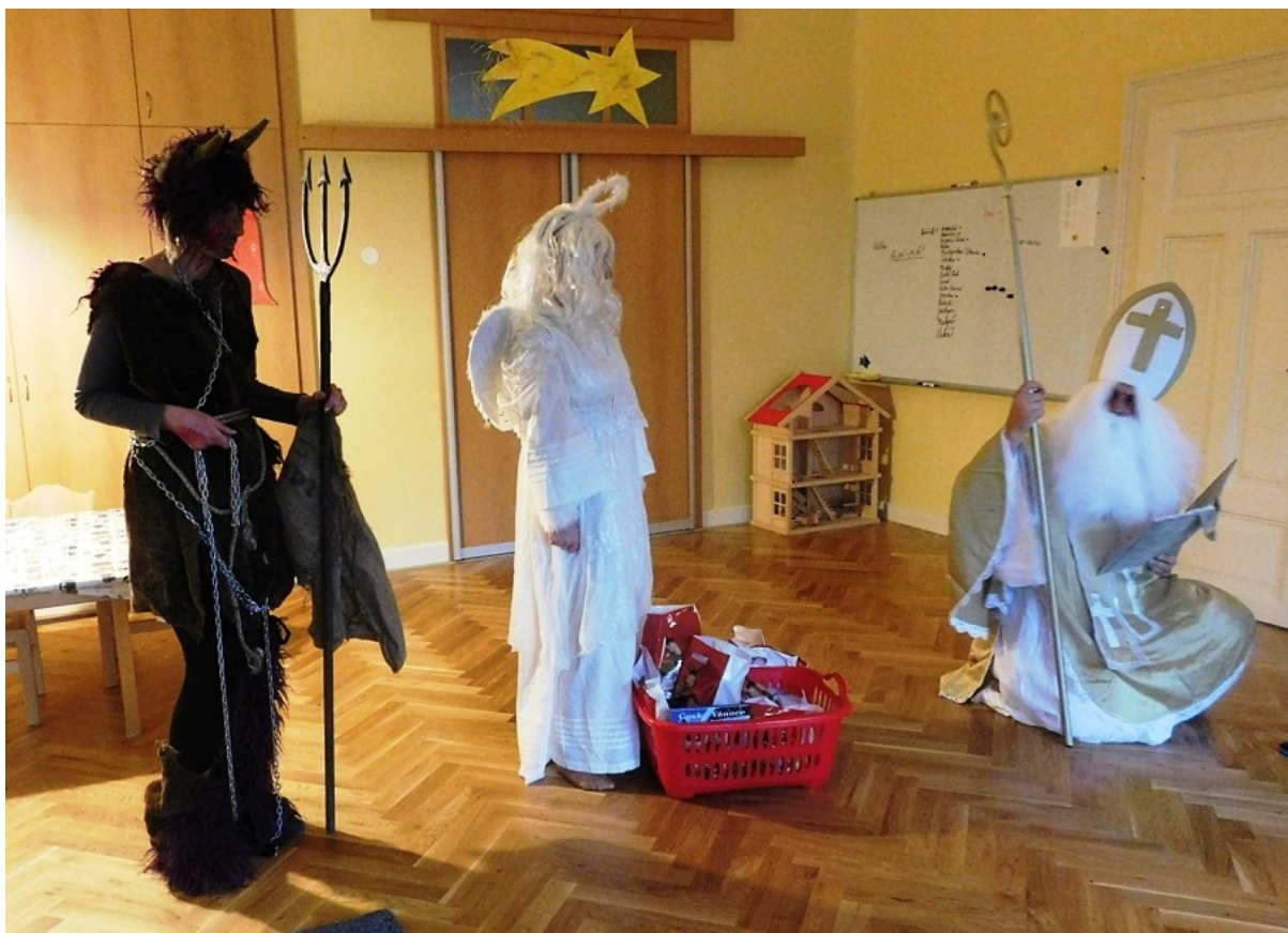
Mikulášská nadílka v mateřské školce

Miřejovice · Nová Ves · Nové Ouholice · Staré Ouholice · Vepřek