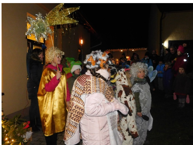
Vánoční pohádka v podání ledčických školáků