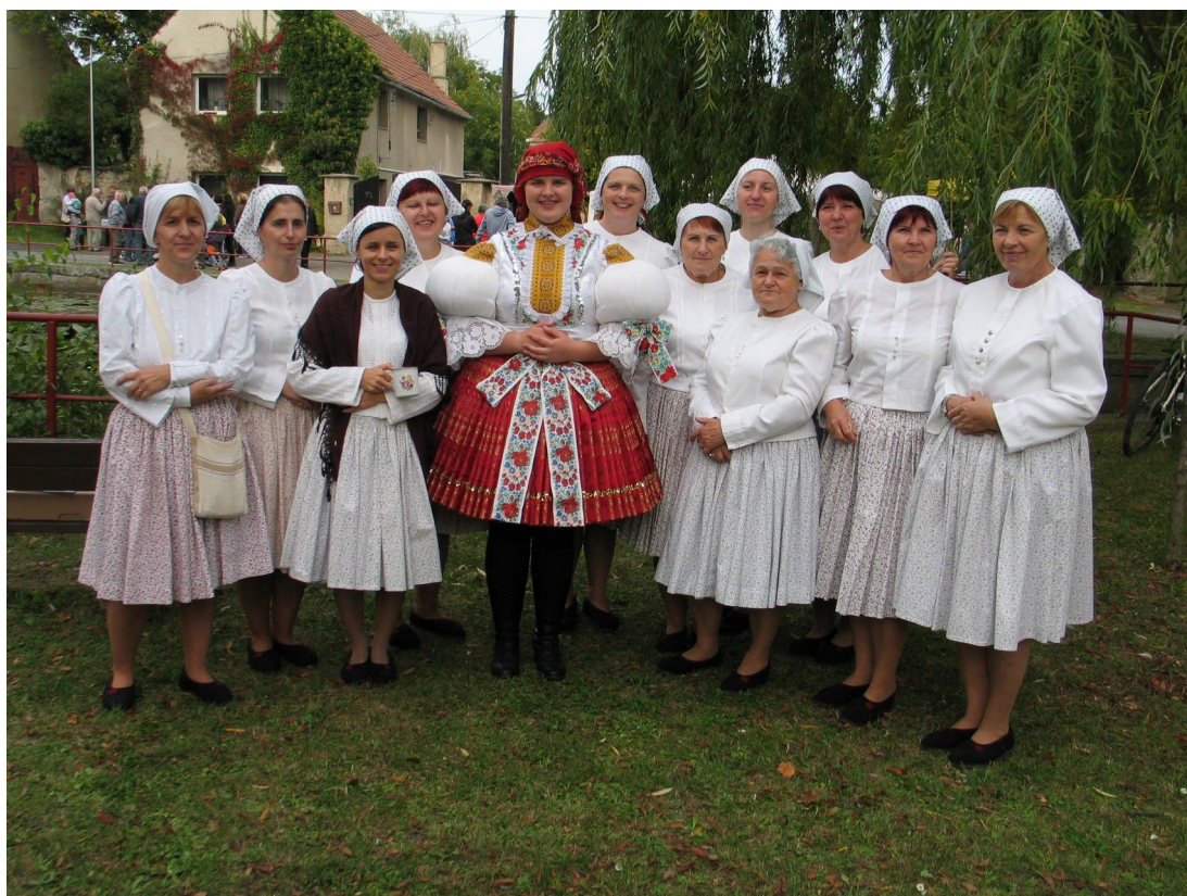
Novoveské posvícení - Nedachlebjanky

Miřejovice · Nová Ves · Nové Ouholice · Staré Ouholice · Vepřek