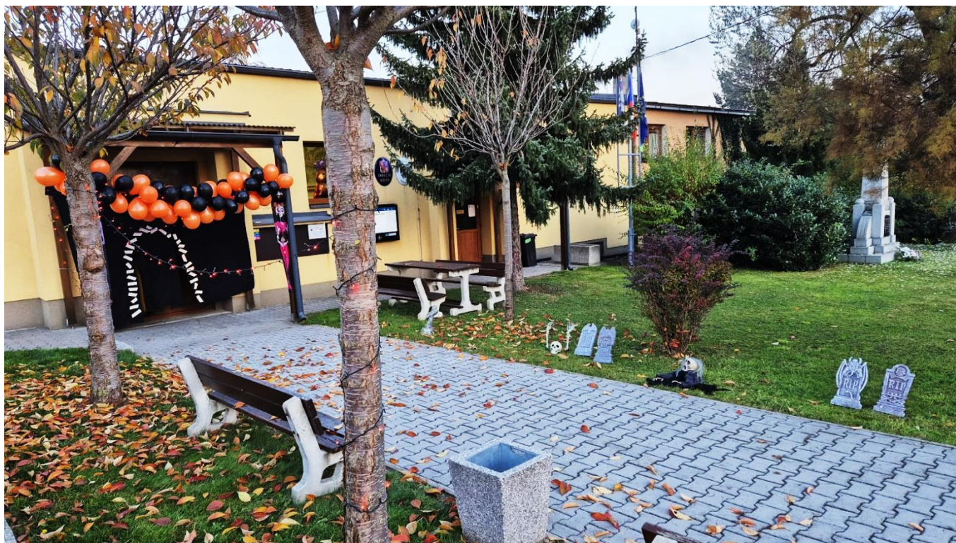
Halloweenská výzdoba před sálem