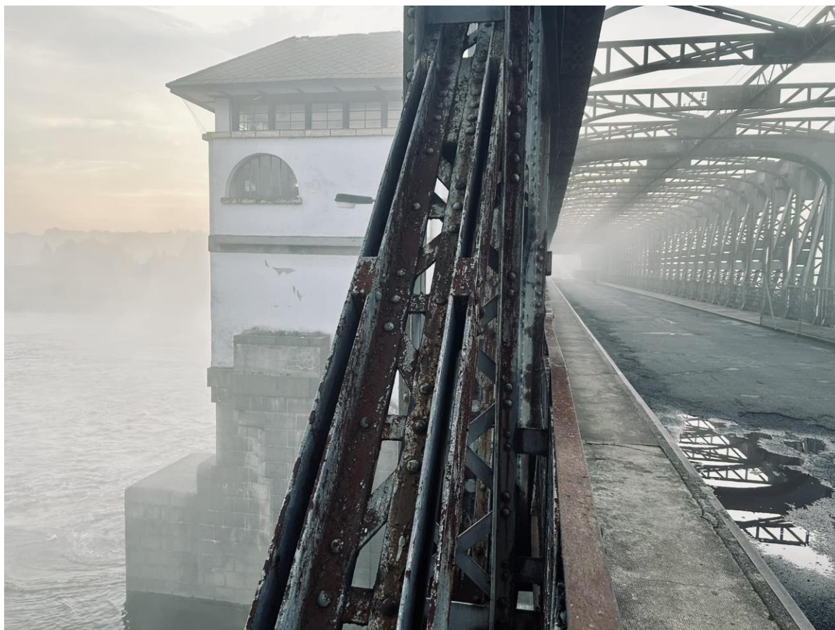
Starý most / FB Přátelé starého mostu