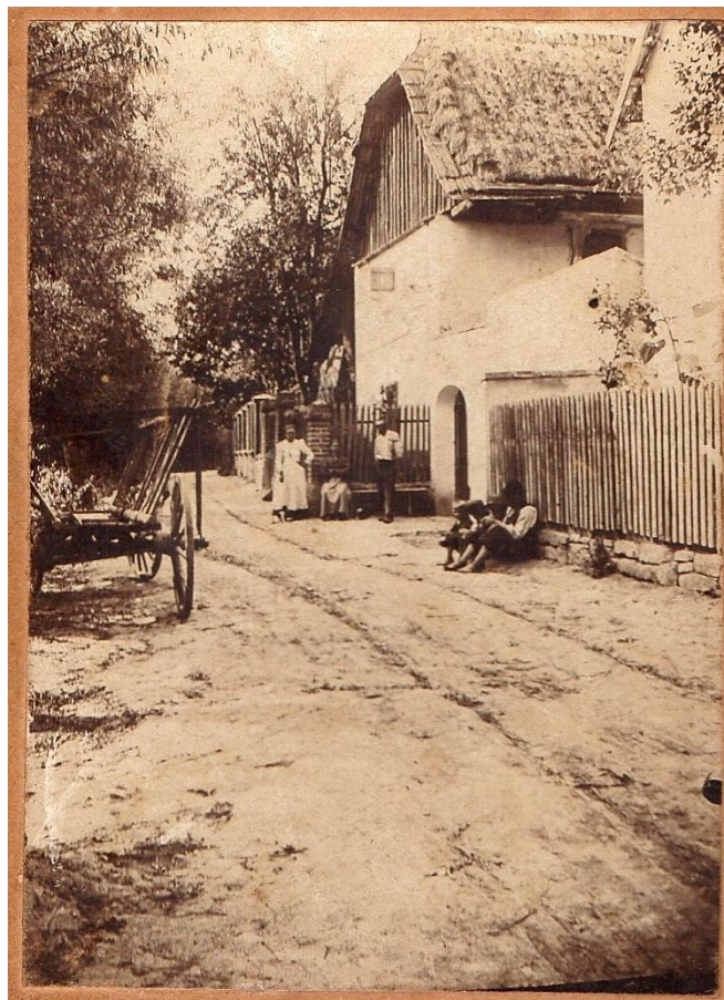
foto: Nová Ves čp. 45 cca z r. 1900