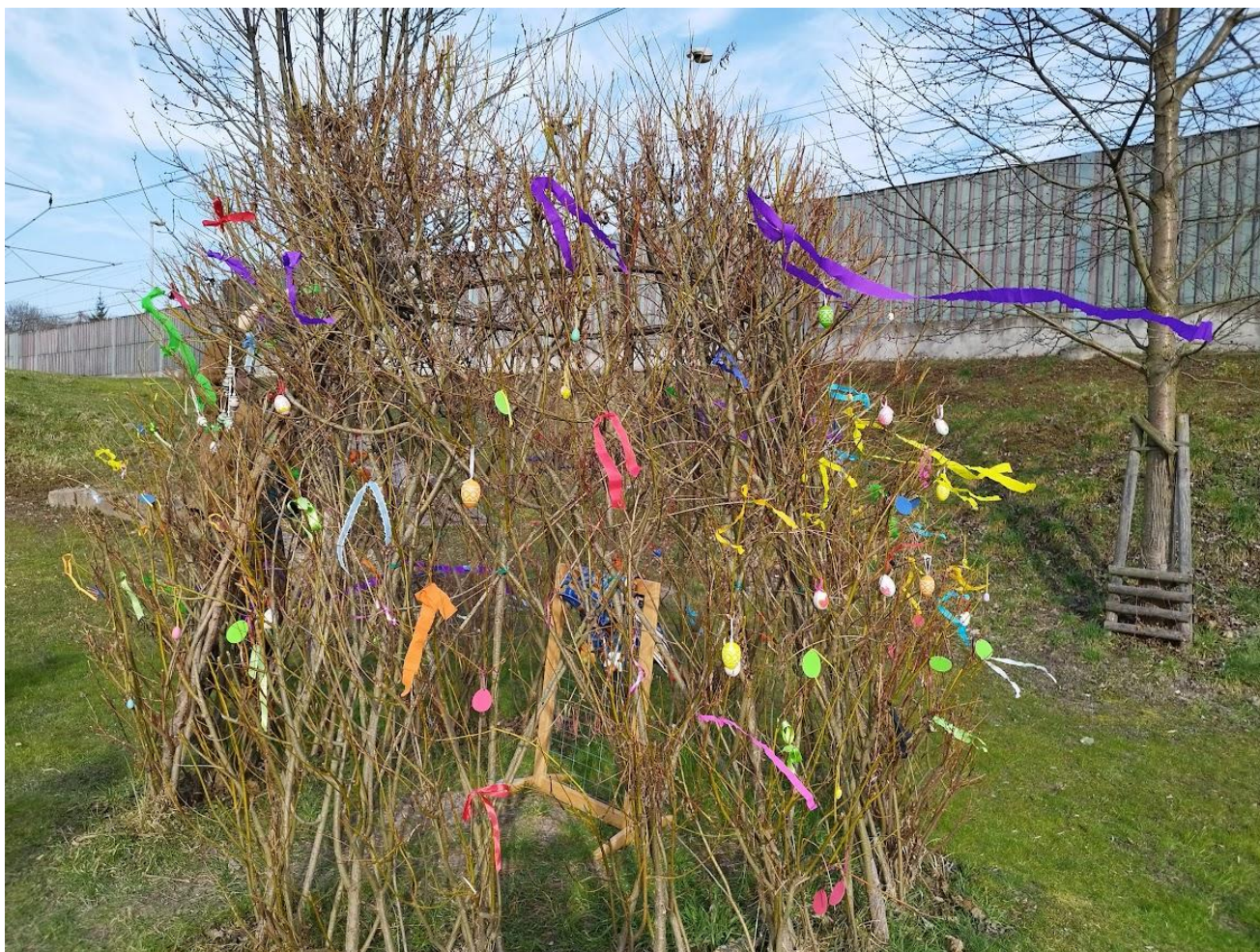
Velikonočně ozdobené iglú v Nových Ouholicích