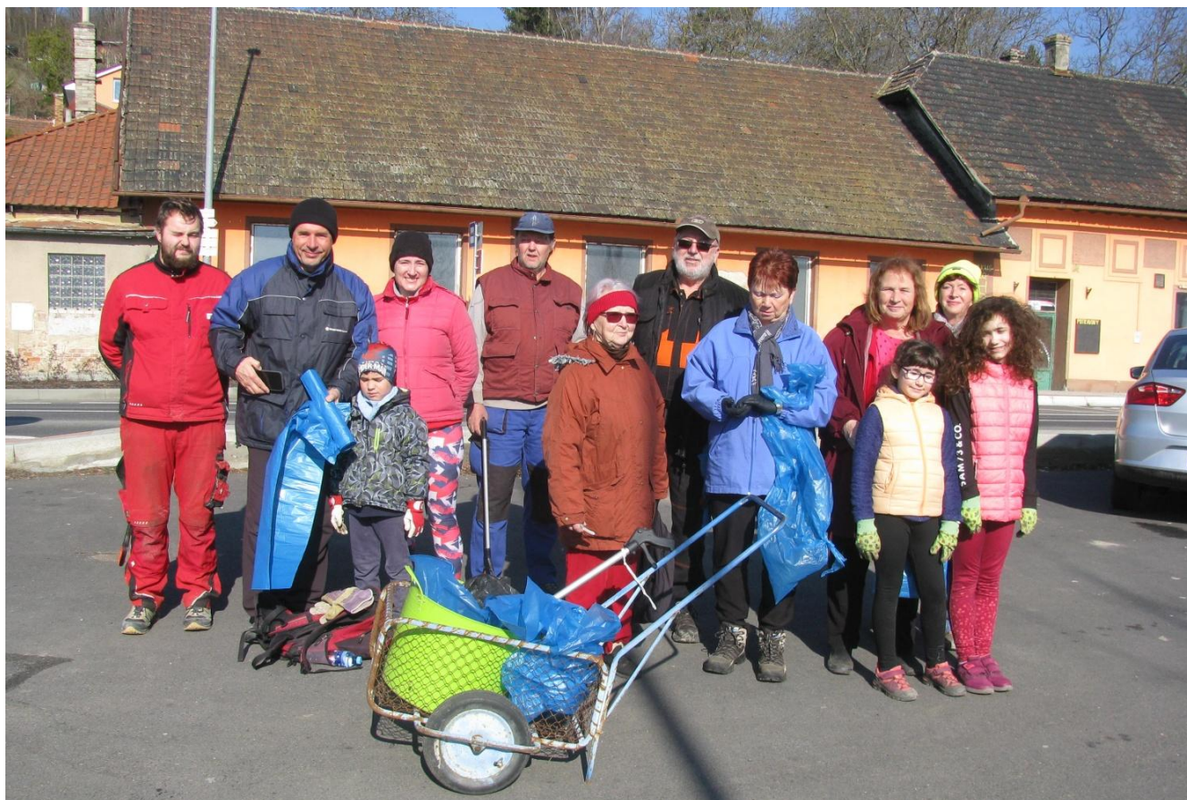
Novoouholetí při jarním úklidu